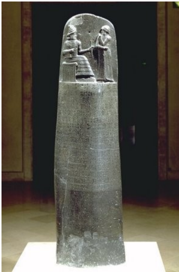
Stele di Hammurabi (1792-1750 a.C.)